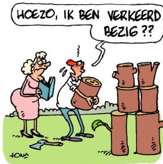
EEN STAMBOOM MAKEN

Een heel gewone dag, waarop van alles mag Van ditjes en datjes, verhalen bedacht van belangrijk tot noodzakelijk geacht. Een dag waarop alle bezigheden worden geschat of je nu plezier of verdriet hebt gehad Met deze dag zul je het moeten stellen of je werkt, luiert of veel moet bellen Op vakantie bent of het huis moet bewaken een gewone dag om een praatje te maken Een dag die jouw activiteiten verwacht waar de hele dag koffie, thee of een borrel op je wacht die heel veel vraagt van je energie en je kracht van het ochtendgloren tot mogelijk diep in de nacht Wat ik je wel vragen mag doe ook gewone dingen deze dag Je hoeft niet met iedereen feest te vieren om ook andere mensen te plezieren Een blij gezicht, een mooi gebaar och, je bedenkt het zelf ook maar Deze dag is voor jou pas echt fijn als er aan het eind twee of meer blijde mensen zijn.